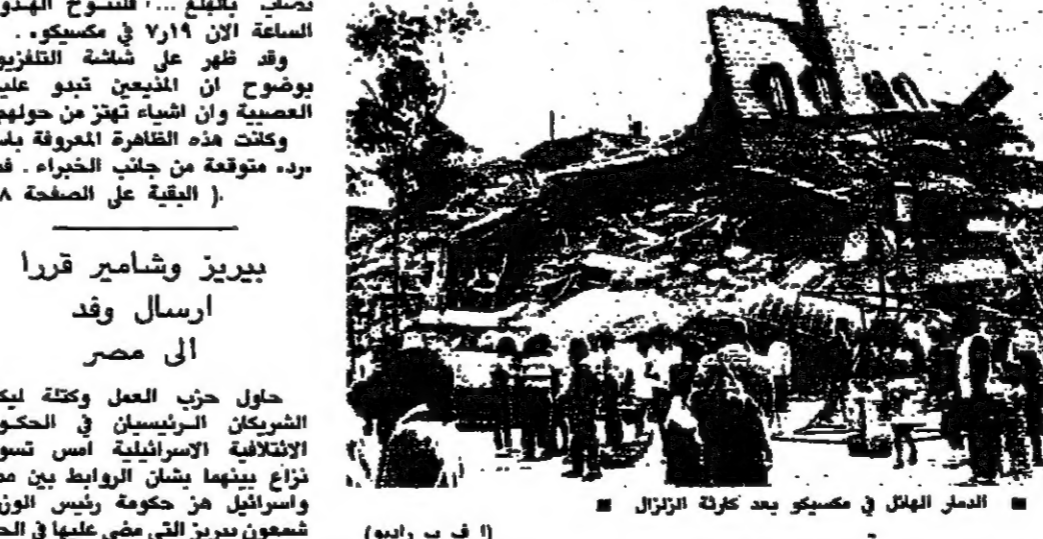
الدمار الهائل في مكسيكو بعد كرتلة الزلزال